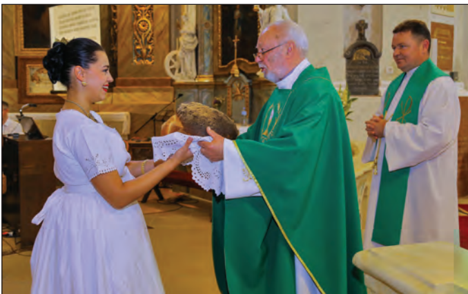
Blagoslov kruva u Crkvi Prisvetog Trojstva u Somboru