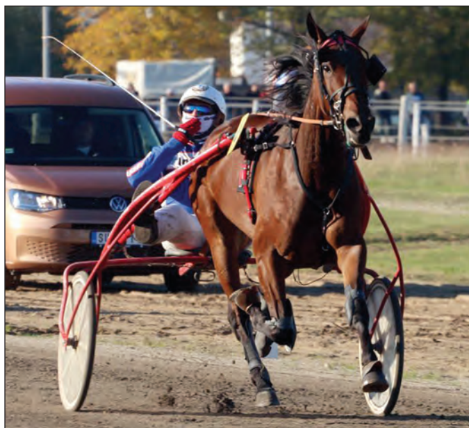
Grlo Sarah Vaughan AT i Branko Skenderović

Što se trećeg dila „Derbi” sezone tiče, iznenađenja nije bilo, grlo Sarah Vaughan AT, koje je i osvojilo „trku život”, nije imalo pravog konkurenta. Grlo Armani B je zaostalo na startu, dok grlo Play The Game nije izdržalo tempo pobjednice koja je od starta do cilja diktirala ritam. Niko nije mogao parirati ni grlu Iago d'Amore koje je još jedared potvrdilo svoju formu, a ispostavilo se da nije bilo tušta dilema ni u maratonskoj na 3.200 metara. Tokom trke je više grla nagošćavalo dobru formu, al u završnici nije bilo dileme, grlo Brenno